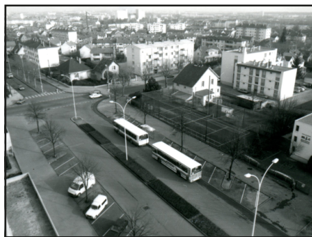
19 Fi

A u 17ème siècle, en partant du Levant (Est), de la croix de Guise ou de Justice (angle de la rue de Chenôve et du boulevard des Peyvets) en cheminant par les ruelles des Hêtres, de Trémolois, du Cerisier et des Bourroches, on arrive au Couchant (Ouest) à la croix de Larrey et au prieuré du même nom. Le cadastre napoléonien identifie des noms de lieux d'Est en Ouest : les Billetottes, en Perret, en Saint-Jacques, en Peyvets, le petit Mont de Vignes, les Grands Saules, les Champs Batrans, les Bourroches et en Pisse-Vin. Nous sommes au début de la côte vineuse.